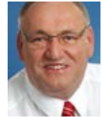
Egon Primas MdL