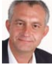
Steffen Lemme MdB