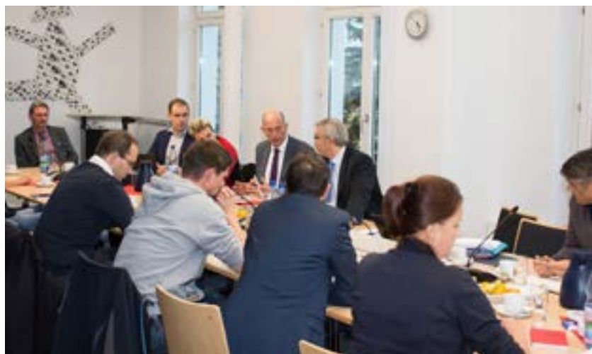
Teilnehmer beim Runden Tisch „Lokal-TV“