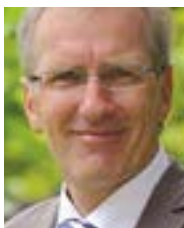
Gerold Wucherpfennig MdL