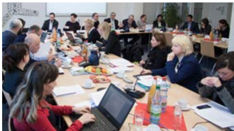
Sitzung der TLM-Versammlung

Die Versammlung bestätigt die medienrechtliche Unbedenklichkeit der am 1. April angezeigten Änderungen der Beteiligungsverhältnisse an der REGIOCAST GmbH & Co. KG und damit auch an der LandesWelle Thüringen GmbH & Co. KG.