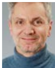
André Blechschmidt MdL