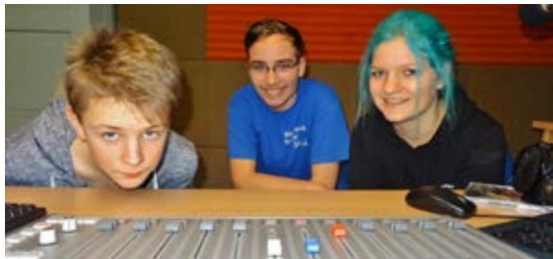
Junge Radio- macher vom Wartburg- Radio 96,5

Bei der Medienbildung wird ebenso wie beim Redaktionsmanagement inhaltlich auf einen Teilbereich der Arbeit der Bürgersender fokussiert. Aktuell liegt ein Modell von Qualitätskriterien der Medienbildung in Bürgermedien vor, welches hinsichtlich dreier Ebenen (Angebots- und Einrichtungs-, Durchführungs- und Ergebnisqualität) Kriterien definiert. Hierbei findet eine Verschränkung zur Organisationsentwicklung und zum Redaktionsmanagement statt. Der Katalog ist als Anreiz für die Anwendung und die Ausgestaltung im Sinn einer Option zur Umsetzung zu verstehen. Das Modell für Qualitätskriterien von Medienbildung in Bürgermedien wurde im Medienbildungsbericht der Landesmedienanstalten publiziert.